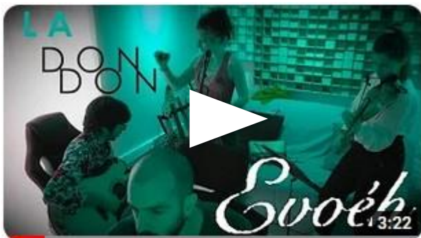
Cançó de bressol de Tarragona (La don don) - Obra del Cançoner Popular de Catalunya

entre sonoritats folk, electròniques i flamenques.