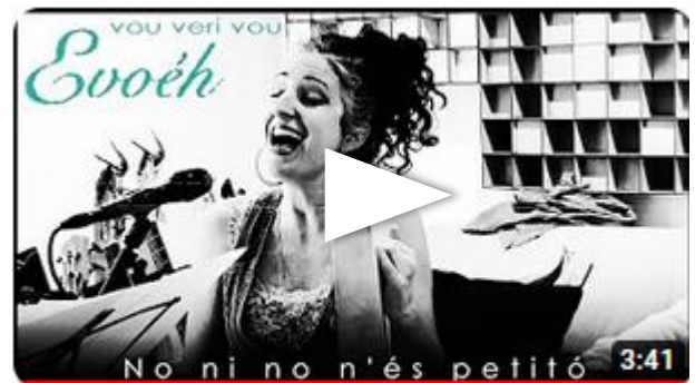
Cançó de bressol de Mallorca - Vou veri vou